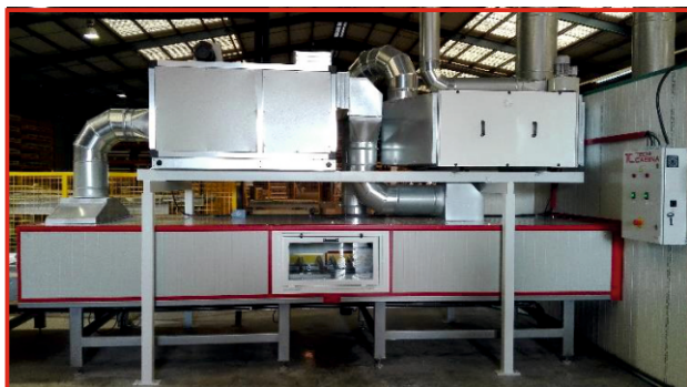
Hornos de secado