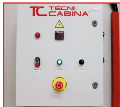
Armario eléctrico con protección de motores, iluminación y señalización