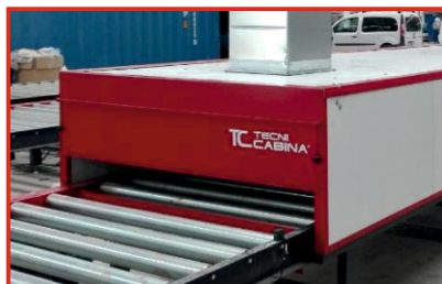
Detalle del transportador de piezas en horno