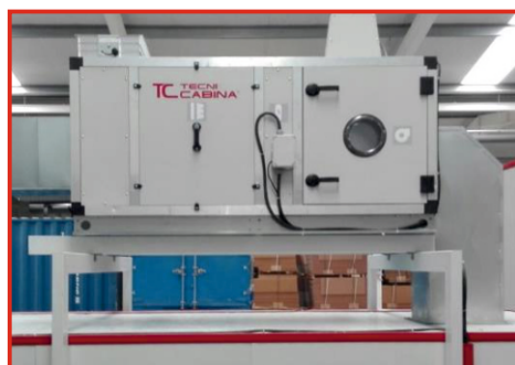
Unidad de aporte y tratamiento de aire situada encima del horno