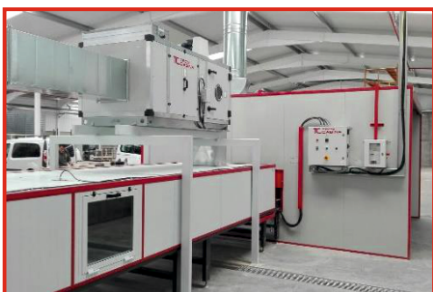
Fase 1: Horno de precalentado